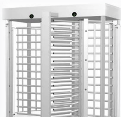
Tornello a tutta altezza